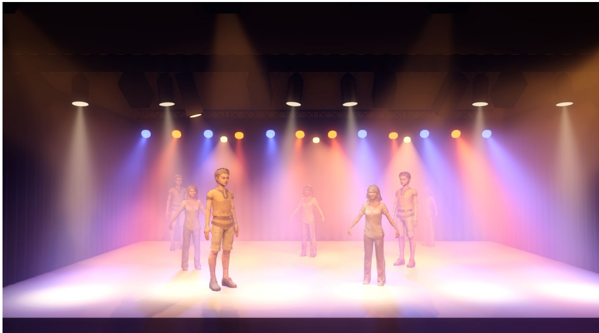
Plan devant scène