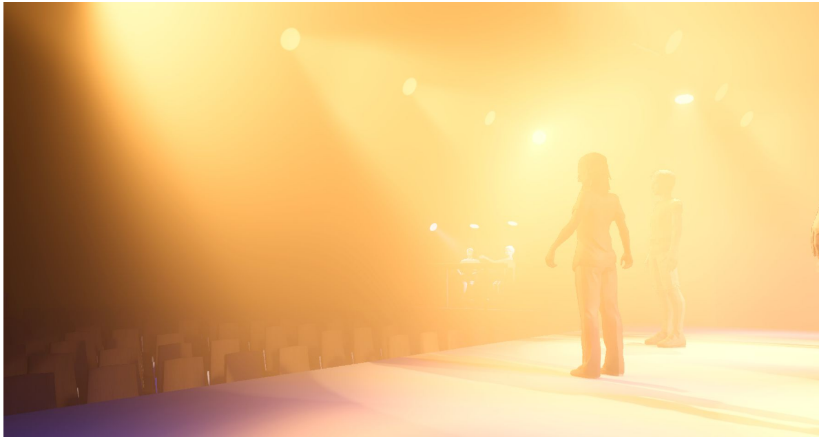
Plan sur scène